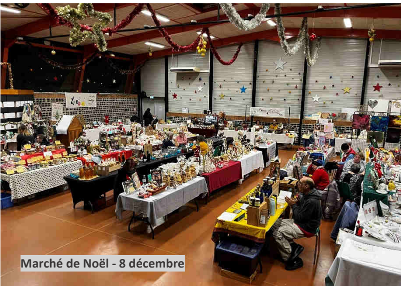
Marché de Noël - 8 décembre