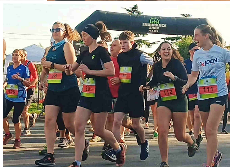
Trail de Cunac - 13 octobre