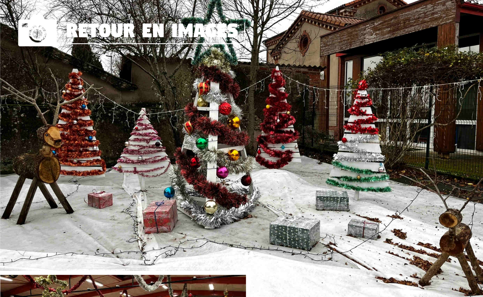
Décorations Noël - décembre 2024 (rond-point de l'école)