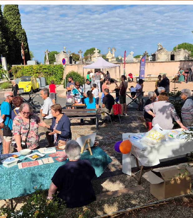
Forum des Associations - 8 septembre